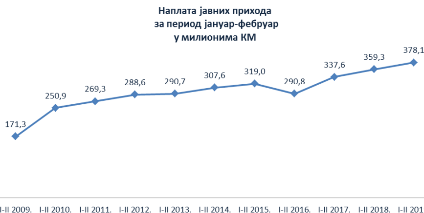
17. Табела: Наплаћени јавни приходи јануар-фебруар 6 (у КМ)

По основу директних пореза наплаћено је 65,2 милиона КМ, што у односу на јануар-фебруар 2018. године мање за 229,8 хиљада КМ. Приходи по основу доприноса износили су 246,9 милиона КМ што представља повећање од 22,7 милиона КМ или 10% у односу на прва два мјесеца 2018. године, док је по основу осталих јавних прихода наплаћено 65,9 милиона КМ што је за 2,6 милиона КМ или за 4% више у односу на јануар-фебруар 2018. године. Разлог мање наплате осталих прихода (3.4) је у чињеници да Акцијски фонд Републике Српске још није уплатио приход по основу дивиденде и удјела у профиту у јавним предузећима, а што је учинио у овом периоду прошле године.